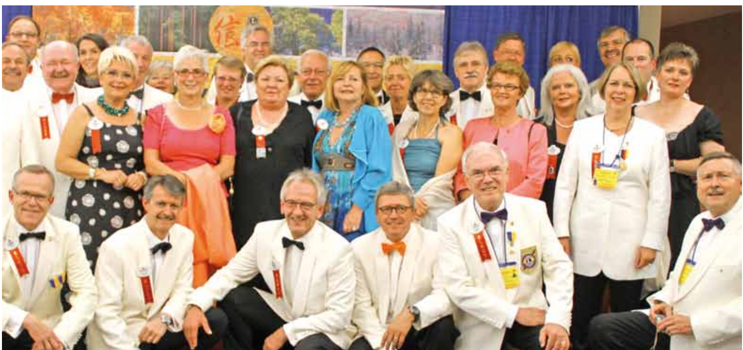
Gutgelauntes Abschlussfoto: Die deutschsprachige Gruppe der Governor mit Partnern, hier noch als elec, mit ihren niederländischen, österreichischen und schweizerischen Amtskollegen.