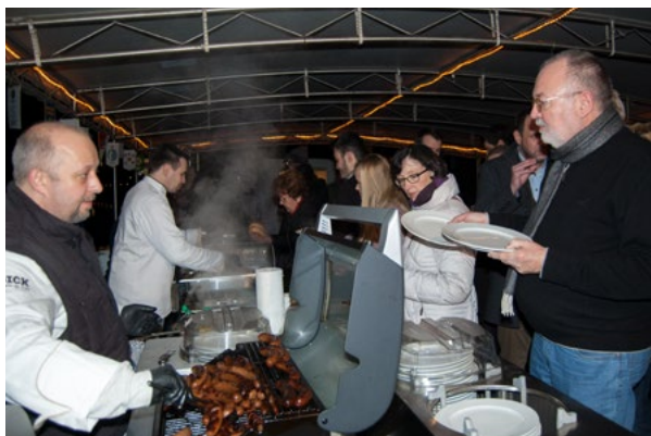
Gingen weg wie die buchstäblich "warmen Semeln": Die nur beim Jahresabschluss erhältlichen Winterbratwürste.

Über 100 Lions- und LEO-Mitglieder verwandelten am vergangenen Jahresende die "Johann Wolfgang von Goethe" zu einem fröhlichen "Barbecue-Boat". Vor der illuminierten Skyline schipperte die "Goethe" auf dem Main, Lions, LEOs und viele Angehörige so-