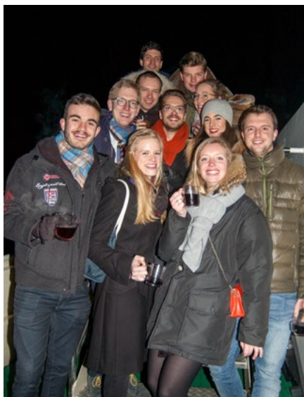
Hatten Spaß: Die LEOs waren stark vertreten und ließen es sich schmecken.

So soll es auch in diesem Jahr wieder werden. Am Donnerstag, 28. Dezember, öffnen sich um 18:00 Uhr die Schiffstüren, um 18:30 Uhr legen wir zur definitiv letzten