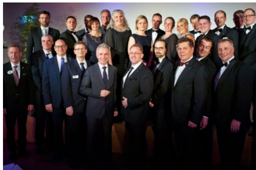
Gruppenbild mit Oberbürgermeister (vo., 5. v.li.): Der neue Lions Club Frankfurt – Goldene Bulle