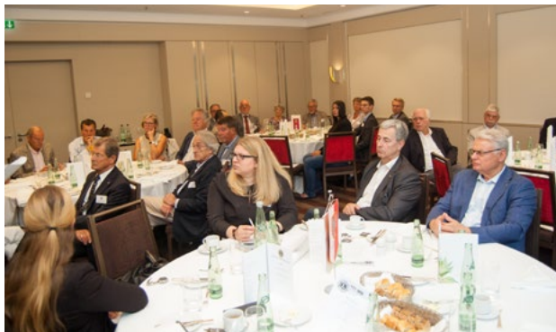
40 Lions und Leos waren wieder beim Mittagstisch dabei.