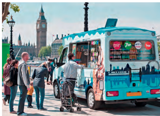
Foodtrucks: Die mobilen Küchen sind in verschiedensten Varianten anzutreffen.

„Das bringt uns ins Gespräch mit Menschen aller Altersklassen und verschiedenster Herkunft“, sagt Andel. Die Botschaft dabei ist klar: Die Lions setzen mit ihren Projekten, ihrem Netzwerk und Sponsoren Hebel in Bewegung. Auch sollen andere Vereine und Clubs den Lions-Foodtruck nutzen können. Der Club ergänzt damit eine seiner Erfolgsgeschichten, die bereits seit Jahren auf der Straße rollt: Der Lionsbus. Er ist mit einer elektrischen Hebevorrichtung ausgerüstet und kann bis zu zwei Rollstuhlfahrer oder bis zu neun Personen befördern. Der Kleinbus wird zum Beispiel von der Seniorennachbarschaftshilfe für Fahrten zu einem Einkaufsmarkt sowie von Jugend-sportvereinen genutzt.