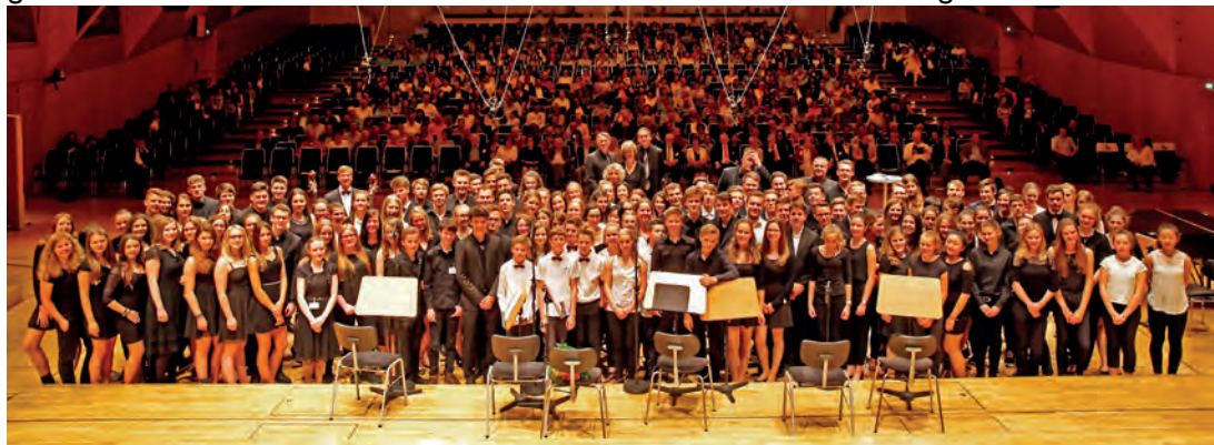
Gemeinsam glücklich. Teilnehmer wie auch Zuhörer erlebten ein wunderbares COACH 'N' CONCERT-Finale.

13 Schulorchester aus Hessen hatten sich zu Jahresbeginn für das Coaching beworben. Drei davon – die Bischof-Neumann-Schule Königstein, die Oranienschule Wiesbaden und die Kurt-Schumacher-Schule Karben - kamen letztendlich dann über einen Zeitraum von fünf Monaten in den regelmäßigen Genuss, von den Profis des hr-Sinfonieorchesters musikalisch trainiert zu werden. Nach Abschluss der Trainingszeit waren die Orchester der drei teilnehmenden Schulen eingeladen, das von ihnen mit den Coaches einstudierte Programm im großen hr-Sendesaal vorzutragen. Insgesamt musizierten rund 150 Schülerinnen und Schüler an dem grandiosen Abend.