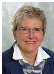
KABINETTSBE- AUFTRAGTE JUTTA SCHRAMM