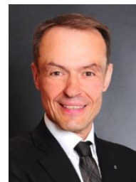
GOVERNOR 2019/2020 HÜESYIN ÇAKIR