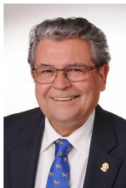
GOVERNOR 2018/2019 WOLFGANG DEBLER