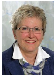
KABINETTSBE- AUFTRAGTE JUTTA SCHRAMM