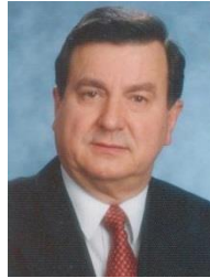
GOVERNOR 2020/2021 FRANZ GÖHL