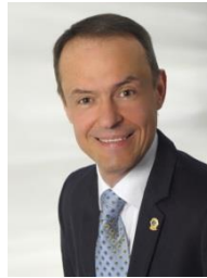
GOVERNOR 2019/2020 HÜESYIN ÇAKIR