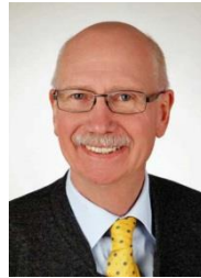
PGRV UND GOVERNOR 2021/2022 WILHELM SIEMEN