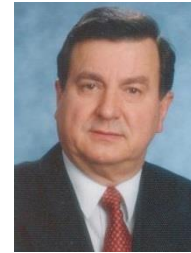
GOVERNOR 2022/2023 FRANZ GÖHL