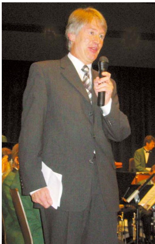
Auch als Moderator perfekt: LF Konrad Jelden, Polizeipräsident im Regierungsbezirk Stuttgart.

Einem wunderschönen Konzertabend mit dem Jugendsinfonieorchester des Landkreises Ludwigsburg folgte als Höhepunkt unserer bisherigen Aktivitäten nunmehr ein Benefizkonzert in der neuen Vaihinger Stadthalle mit dem Polizeimusikkorchester des Landes Baden-Württemberg.