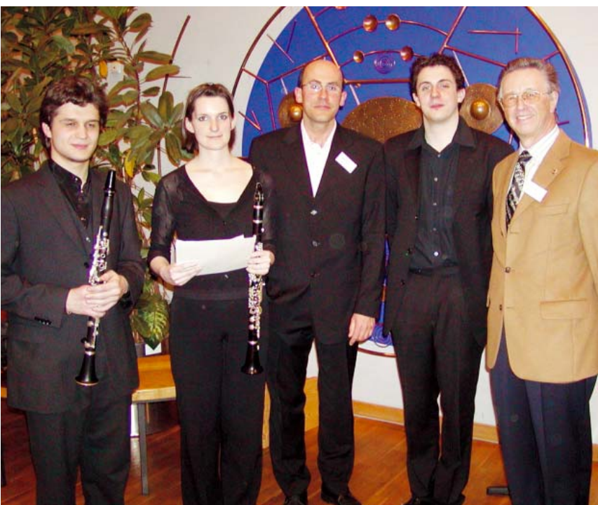
Schöne Erinnerung an den Musikwettbewerb in der Bayerischen Musikakademie: die Übergabe der Preise an die vier Gewinner.

Die äußerst positive Resonanz von TV Allgäu, Radio Ostallgäu sowie zahlreicher regionaler und überregionaler Zeitungen bestätigt die Wichtigkeit des Werbefaktors Kultur für die Clubs und für die Lions-Bewegung insgesamt. „Sie haben eine neue Dimension und eine neue Qualität geschaffen“, sagte DG Baiker in seinen abschließenden Dankesworten an Klaus Hampfl, der im Übrigen stolz darauf sein konnte, dass der Distrikt zur Finanzierung nicht einen Cent beisteuern musste.