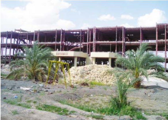
An diesem Wiederaufbauprojekt beteiligen sich Lions. Unten: Ein vom Erdbeben zerstörtes Waisenhaus.