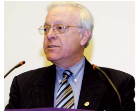
Vertreter mehrerer UN-Organisationen sprachen über ihre Partnerschaft mit Lions.