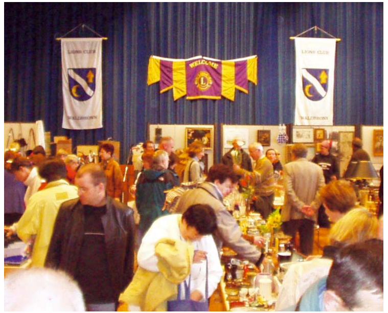
Basare, Auktionen, Märkte – der LC Waldbronn schafft immer wieder ein volles Haus, um erfolgreiche fund raising activities durchführen zu können,

In den beiden zurückliegenden Jahren hat der Club dafür je 3000 Euro aufgebracht.