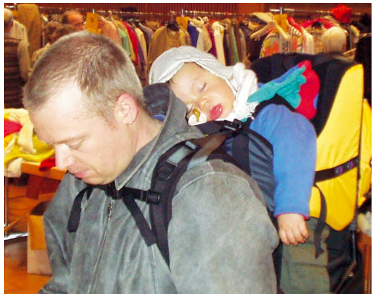
Während der Papa bei der Veranstaltung des LC Waldbronn noch nach Schnäppchen fahndet, hat es sich der kleine Begleiter schon gemütlich gemacht.