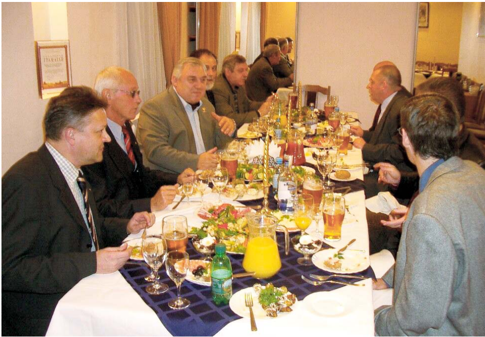
Das erste Kennenlernen der Delegation fand bei einem weißrussischen Abendessen im Restaurant Rodnik (Quelle) statt.