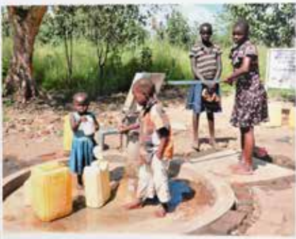
Mit einem Brunnen von Brunnen, wir hier im Südsudan wird die Grundlage für ein gutes Wassermanagement geschaffen. Ingerand wird unter anderem eine richtige Hygiene in Familien vermittelt.

angewandt, die in Zusammenarbeit mit den betroffenen Lions-Partnern, die Wasser-Hilfsorganisationen Hilfen, umgesetzt werden. Mit diesen Wasserprojekten können wir in denen vier Ländern der Südsudane für Wasser und damit für Nahrungssicherheit helfen und human Hygiene sorgen und sauberen Wasser für die Flucht und Migration unterstützen. So verbessern wir die Wasser- und Sanitärversorgung in unseren Campaign 100 Projektländern Mali, Niger, Tschad und Südsudan. Die Projektaktivitäten sind je nach Zielort unterschiedlich geartet.