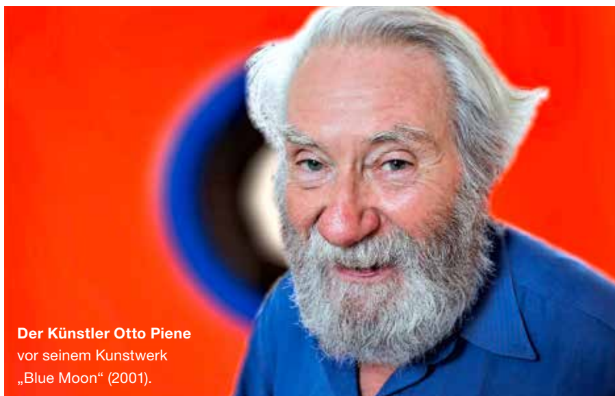
Der Künstler Otto Piene vor seinem Kunstwerk „Blue Moon“ (2001).

Otto Piene ist zwar 2014 verstorben, aber er hat 2001 eine 50er-Edition produziert, die bis heute in seinem Atelier lag und als verschollen galt. Es ist eine für Piene sehr typische Arbeit im Querformat 70 x 100 cm mit leuchtend rotem Hintergrund und einem schwarz-blauen Kreis im Zentrum.