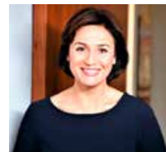
Sandra Maischberger (moderiert zum dritten Mal die Lions-Benefizgala)