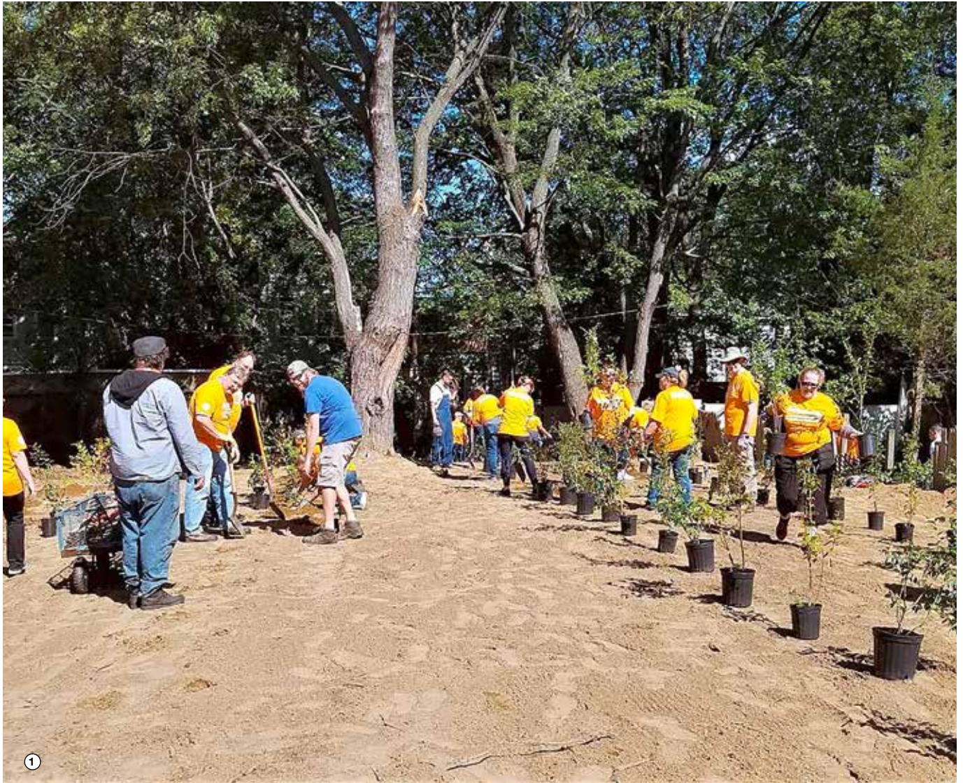
① Lions und andere freiwillige Helfer pflanzen gemeinsam 200 Blaubeersträucher im „Albany Victory Garden“.