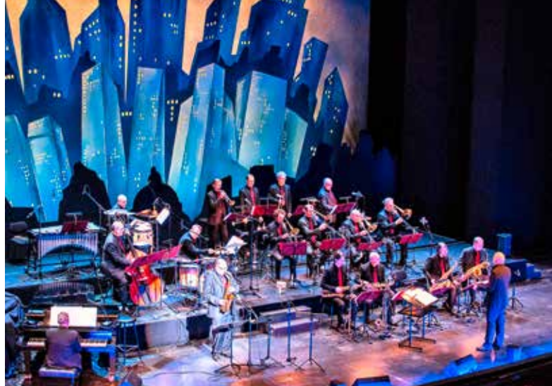
Bigband der Deutschen Oper Berlin