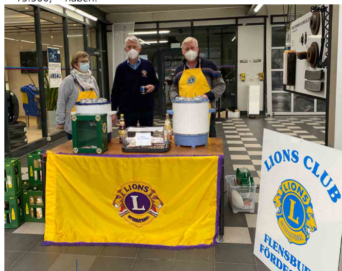
Die Wartezeit bei der Impfaktion wurde vom Lions Club Flensburg Fördestadt mit Schmalzbrot und alkoholfreiem Punsch versüßt.