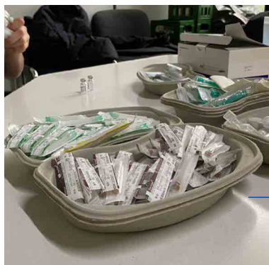
Und dann ging es zur Impfung. Die Impfung wurde durchgeführt von vier Ärzten und vier medizinischen Fachangestellten.